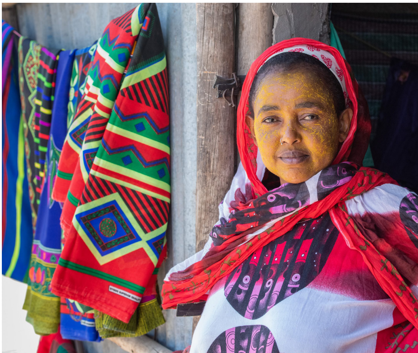
Fra en landsby nær Awash, Etiopien.

Med en geografisk placering langs den østlige migrationsrute på Afrikas Horn er Etiopien et centralt oprindelses- og transitland for irregulær migration. Omkring 382.000 grænssekrydsninger blev registeret i 2023 (heraf omkring 72 pct. udrejsende/28 pct. indrejsende), hvoraf langt størstedelen er arbejdsmigranter på den østlige rute mod Saudi Arabien (ca. 45 pct.). Flertallet af de etiopiske migranter, der migrerer til Saudi Arabien, returneres hårdhændet til Etiopien og kommer tilbage til særligt sårbare situationer, ofte udstødt af deres familier og lokalsamfund, der forventede at modtage økonomisk støtte gennem remitter.