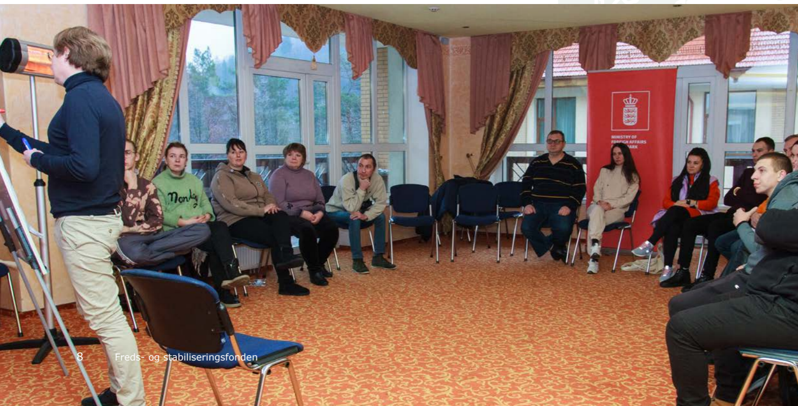
Foto: Center for Humanitarian Dialogue august 2022 – mægling omkring kornaftalen i Sortehavet.

Foto: Vitalii Shevelev / UNDP i Ukraine: Genopbygningstræning for civilsamfundsaktivister og frivillige i Mykolaiv. 20.-21. december 2022.