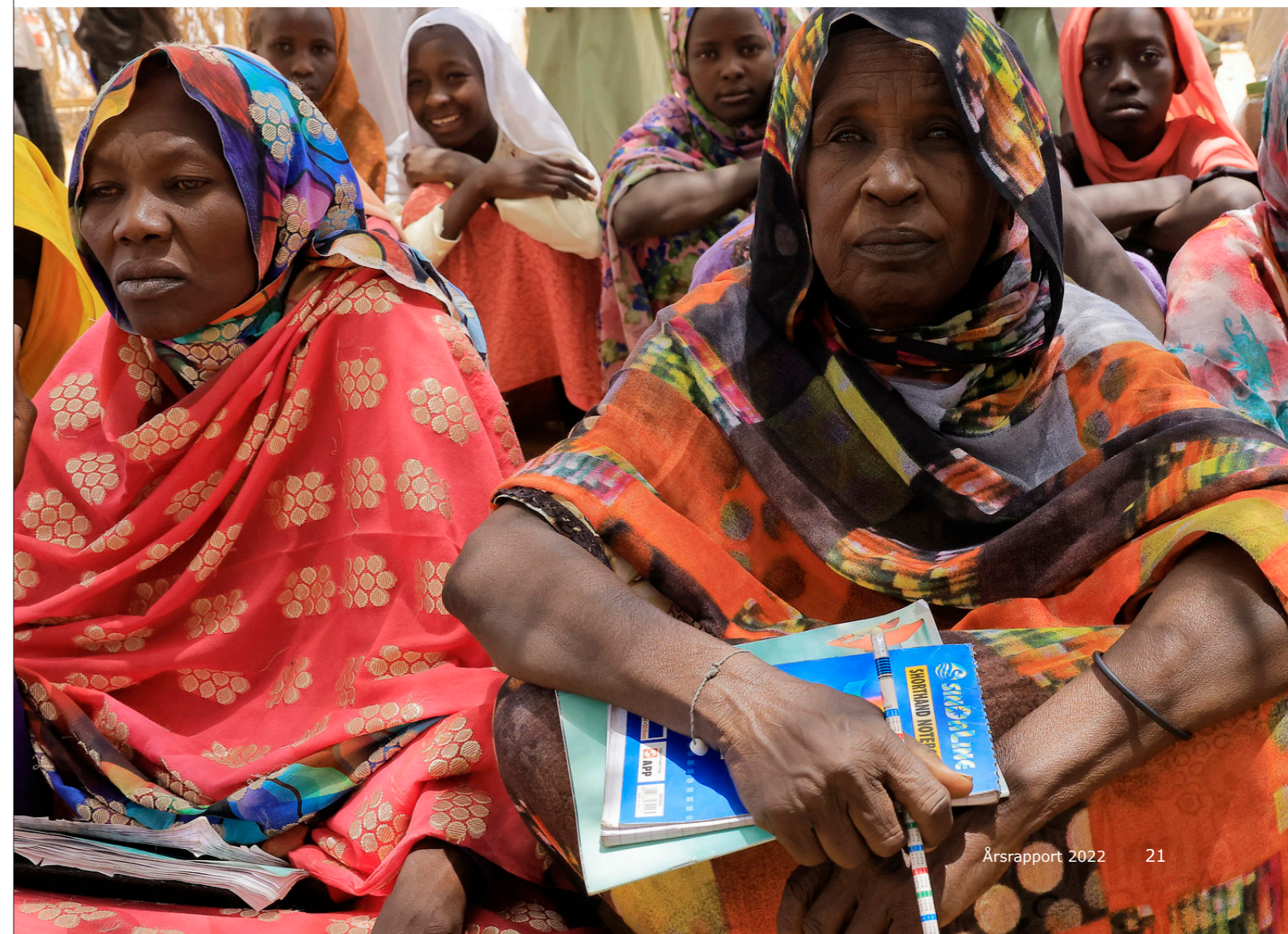
Foto: Fredsopbygningsfondens sekretariat i Sudan: Kvinde deltager i læsekurser på den lokale skole i Umm al Khairat i Øst Darfur.

Danmarks støtte medvirker til, at FN kan give hurtig, fleksibel og risikovillig støtte til konfliktforebyggelse og fredsopbygning.