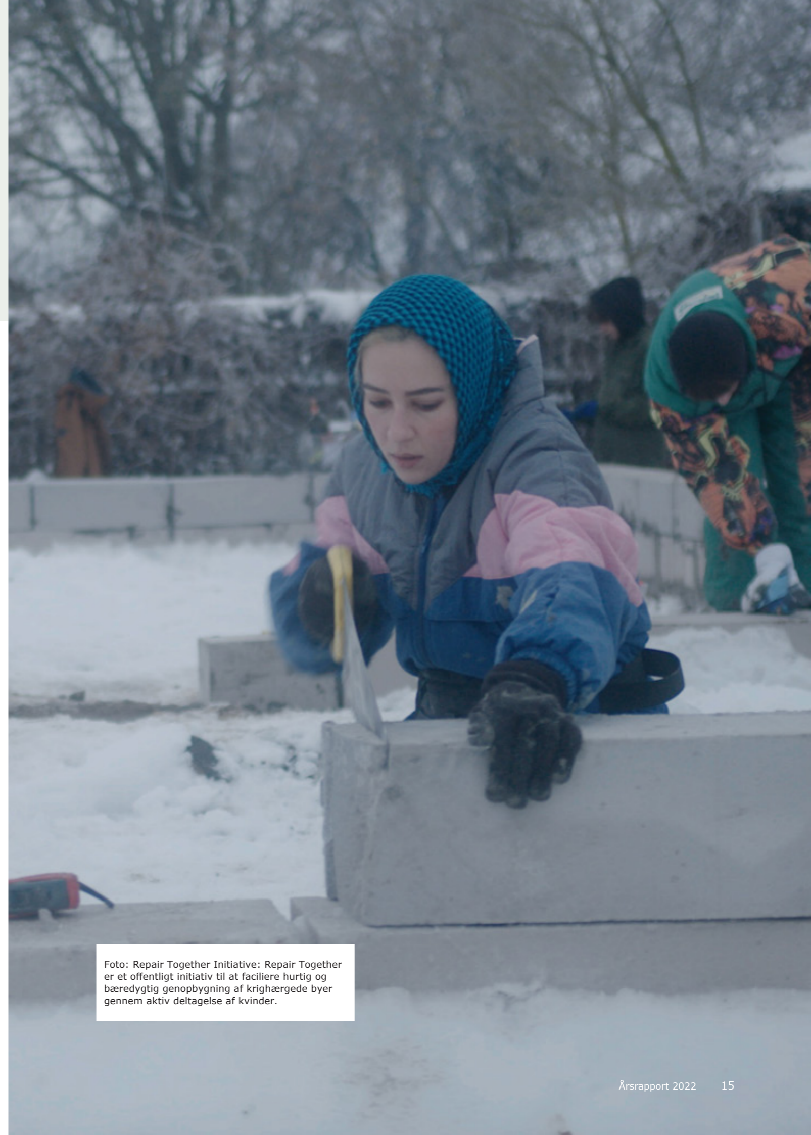
Foto: Repair Together Initiative: Repair Together er et offentligt initiativ til at facilitere hurtig og bæredygtig genopbygning af krigshærgede byer gennem aktiv deltagelse af kvinder.

Endvidere har Forsvaret gennemført træning, bidraget med rådgivning og koordinering af støtten til Ukraine samt støttet Ukraines kapacitetsopbygning gennem NATO Comprehensive Assistance Package.