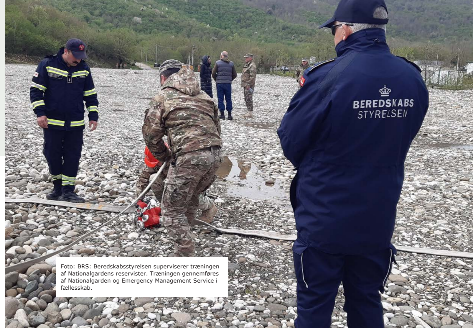
Beredskabsstyrelsen superviserer træningen af Nationalgardens reservister. Træningen gennemføres af Nationalgarden og Emergency Management Service i fællesskab.

Med den nye sikkerhedspolitiske situation, affødt af krigen i Ukraine, har Forsvarsministeriet fra 2023 besluttet at øge den danske støtte til Georgien på både det militære og civile område. I forberedelserne til dette er der således blevet afholdt både "fact-finding-" og forberedelsesmissioner med repræsentanter fra både Forsvarsministeriet, Forsvarskommandoen, Hjemmeværnet, Forsvarsakademiet og Beredskabsstyrelsen. Formålet med den øgede støtte er at styrke georgisk modstandsdygtighed, samt afskrækkelse og afvisning af potentiel russisk aggression.