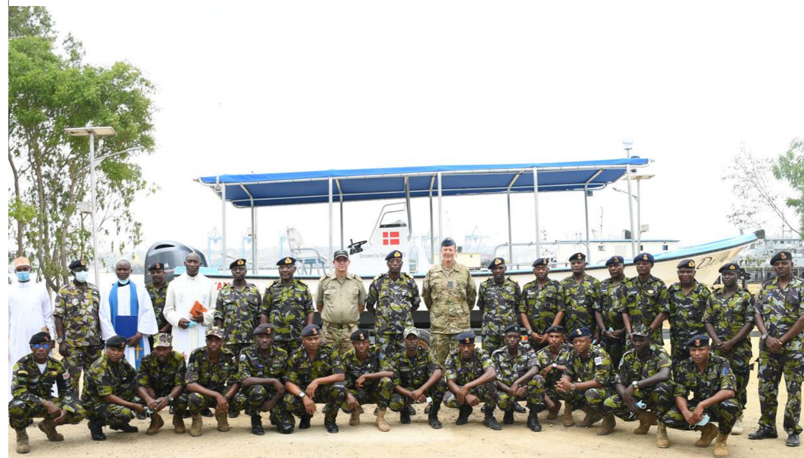
Foto: Kenya Navy Public Affairs: Overdragelse af den første dansk donerede dykkerbåd til Kenya Navy, 2022.

farvand samt indgå som del af Kenyas bidrag til ATMIS-missionen i Somalia. Videre fortsatte man bestræbelserne på at få Kenya optaget som medlem af den amerikanske koalition Combined Maritime Force til bekæmpelse af pirateri og kriminalitet til søs.