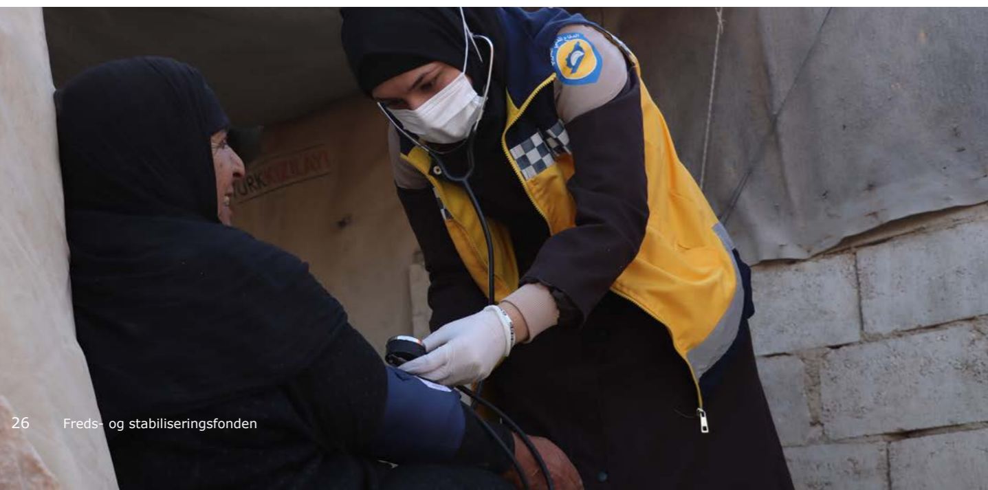
Foto: Hvide Hjelms frivillige: De Hvide Hjelms frivillige responderede til mere end 780 angreb på civile og civile områder i 2022.

Foto: Hvide Hjelms frivillige: De Hvide Hjelms kvindelige frivillige udførte hjemmebesøg i camps for fordrevne i det nordvestlige Syrien.