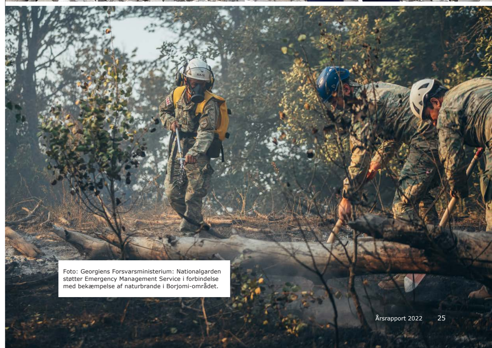
Foto: Georgiens Forsvarsministerium: Nationalgarden støtter Emergency Management Service i forbindelse med bekæmpelse af naturbrande i Borjomi-området.