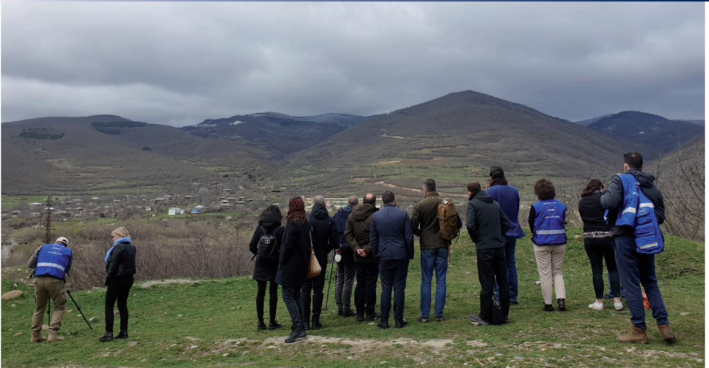
Medlemmer af Europa-Parlamentets underudvalg for sikkerhed og forsvar besøgte i april 2022 EUMM Georgia og ses her ved en administrationslinje (ABL) til Sydossetien.