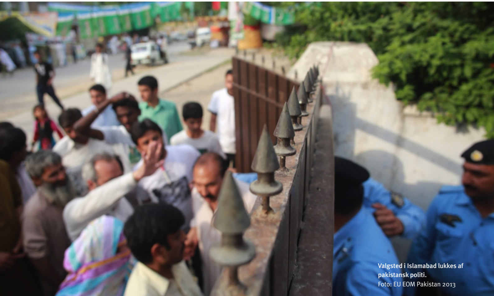
Valgsted i Islamabad lukkes af pakistansk politi.

dræbt 15 journalister. Så vidt vides, er ingen af disse mord opklaret eller straffet.