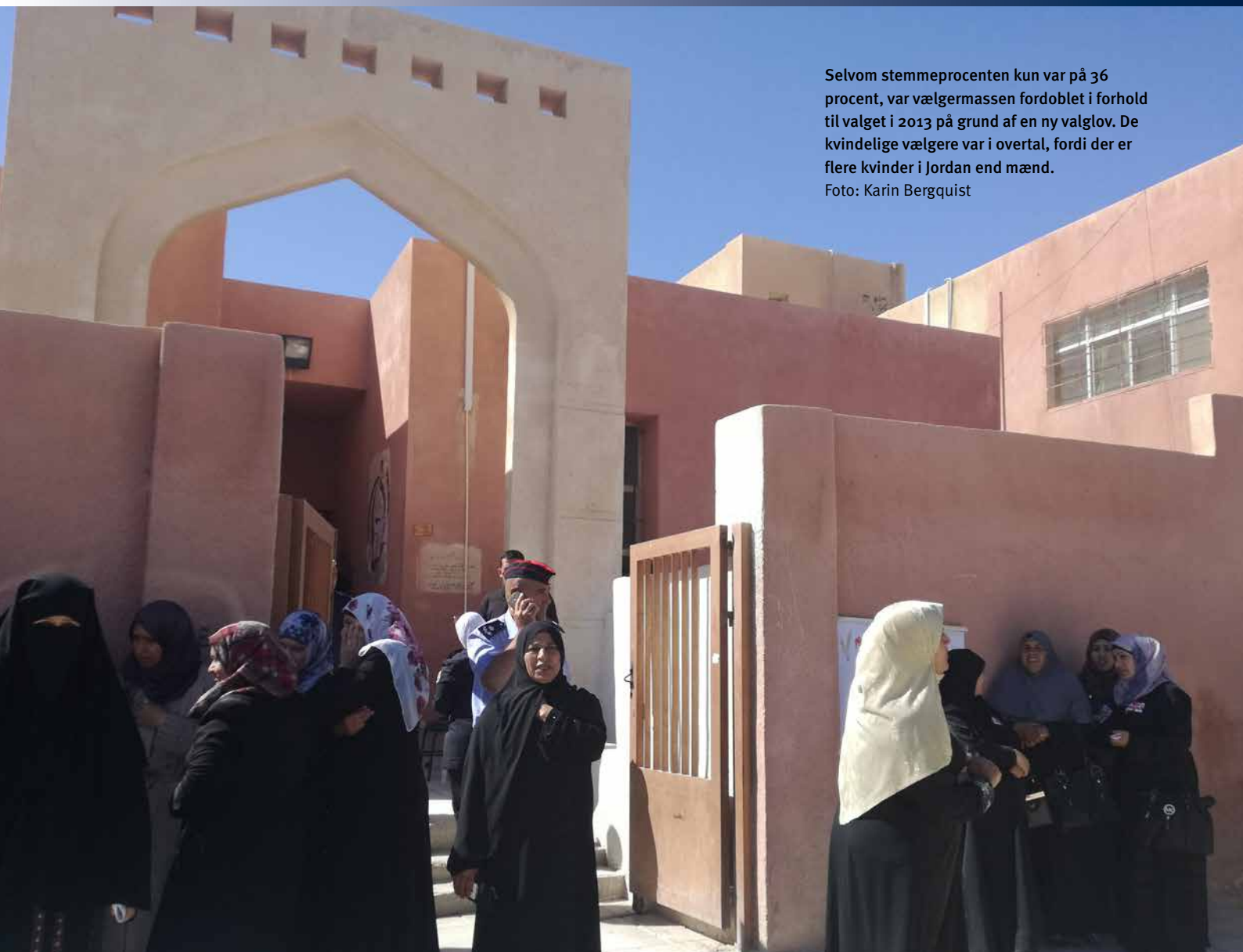
Selvom stemmeprocenten kun var på 36 procent, var vælgermassen fordoblet i forhold til valget i 2013 på grund af en ny valglov. De kvindelige vælgere var i overtal, fordi der er flere kvinder i Jordan end mænd.