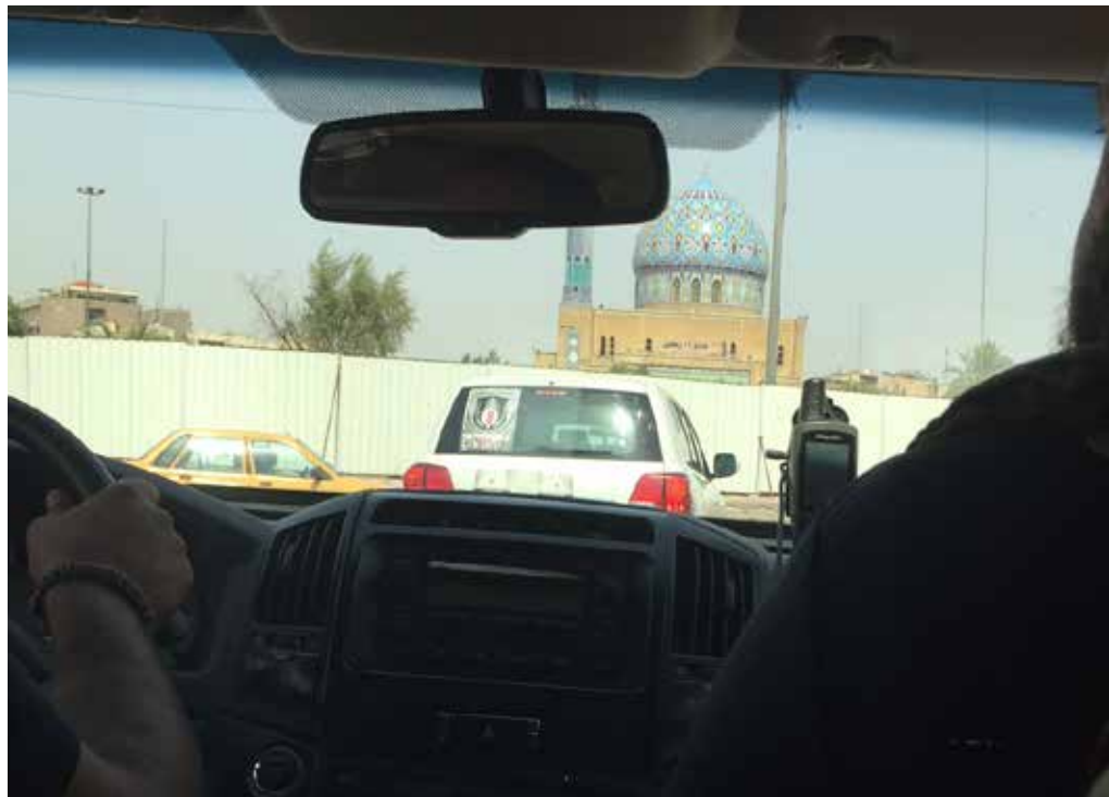
Når missionens internationale eksperter kommer uden for hovedkvarteret, oplever de kun Bagdads byliv gennem ruden på en armeret bil.

”Valget kan godt påvirke vores arbejde, hvis det tager lang tid at danne en