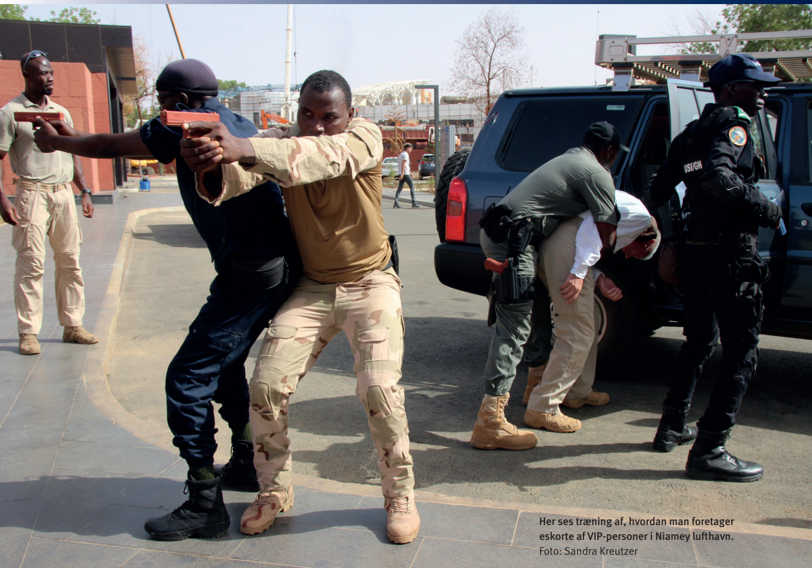
Her ses træning af, hvordan man foretager eskorte af VIP-personer i Niamey lufthavn.

”For tiden er det populært at støtte antiterroraktiviteter. Her er det vigtigt at holde møder om behov og mangler. Hvis det drejer sig om at yde hjælp til træning, skal vi have det koordineret sådan, at nogle fx tager sig af træning i, hvordan man behandler arresterede, formodede terrorister, mens andre kan undervise i, hvordan man sikrer fremskaffelse af beviser til en fremtidig retssag i overensstemmelse med menneskerettighederne og international lov.”