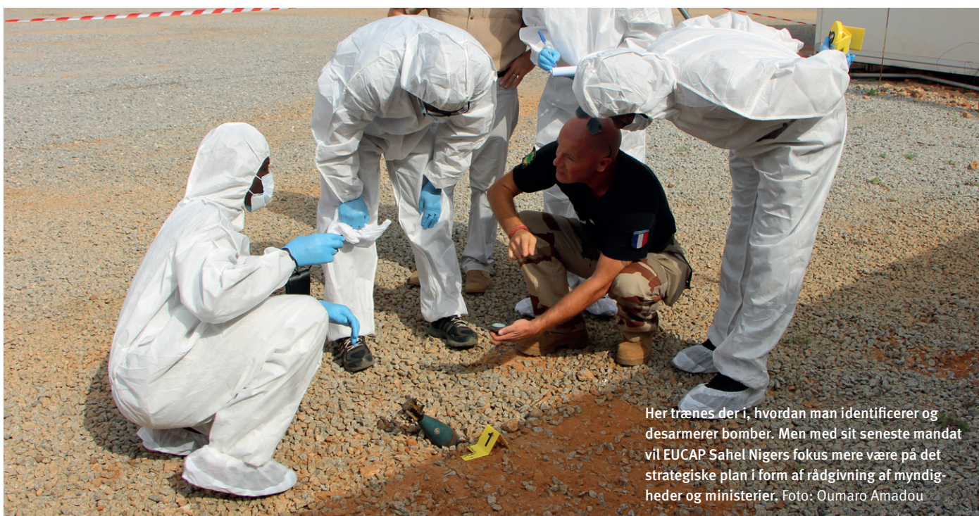
Her trænes der i, hvordan man identificerer og desarmerer bomber. Men med sit seneste mandat vil EUCAP Sahel Nigers fokus mere være på det strategiske plan i form af rådgivning af myndigheder og ministerier.

”Terroristerne – der især er tilstede i grænseområderne mellem Niger, Mali og Burkina Faso – udnytter de gamle konflikter mellem agerbrugere og pastoralister (kvægbrugere, red.) til at skabe usikkerhed, hvilket de har god mulighed for, da