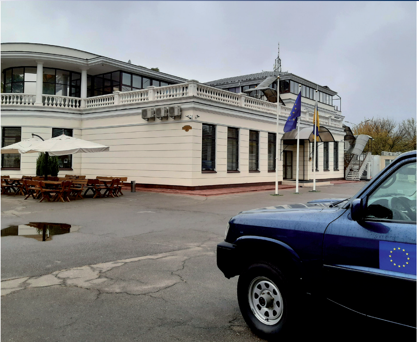
Her ses en af de tre bygninger, som udgør hovedkvarteret for EUAM Ukraine i Kyiv. Efter planen skal de internationalt udsendte være fysisk tilbage i Ukraine i løbet af september.