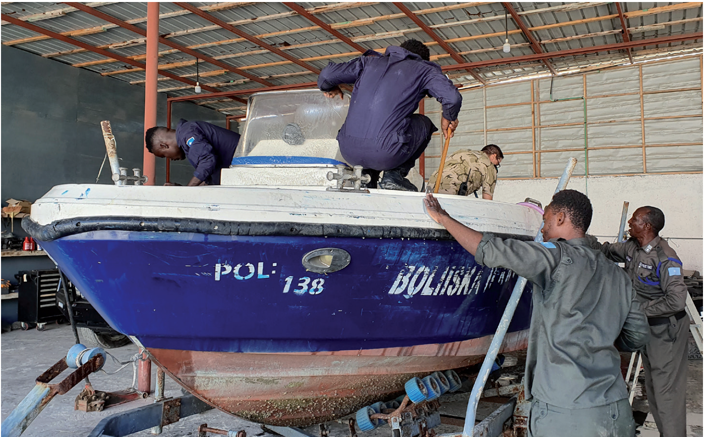
Mangel på sødygtige både hos kystvagten er en af de mange udfordringer for, at Somalias sikkerhedsstyrker selv kan tage vare på landets sikkerhed før 2025.