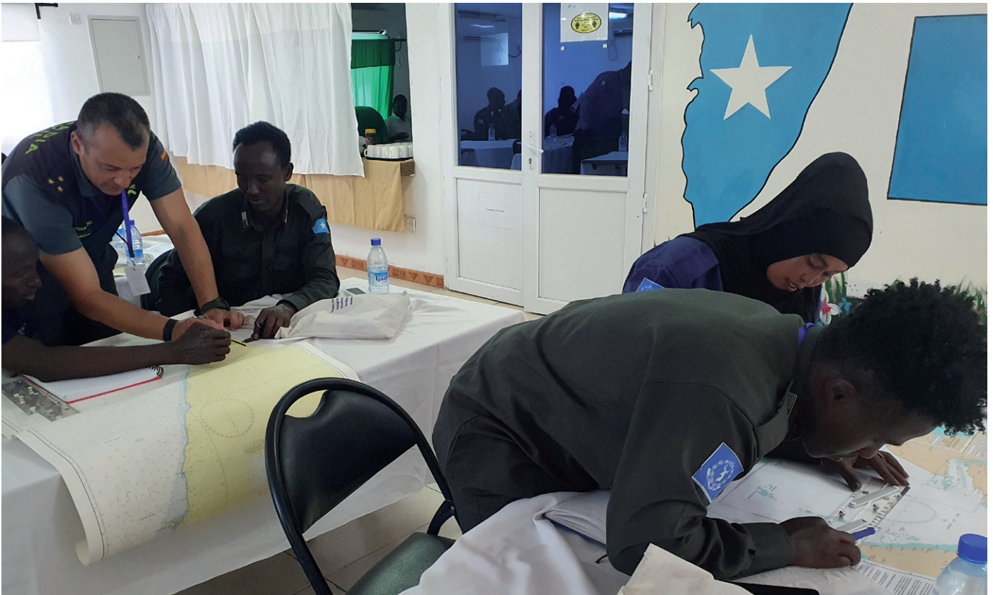
EUCAP Somalia forsøger at involvere så mange kvinder som muligt både i missionens egen rekruttering af internationale og lokale medarbejdere og ved at opfordre samarbejdspartnerne til at få kvinder med i træningen – som her i Maritime Police Unit.