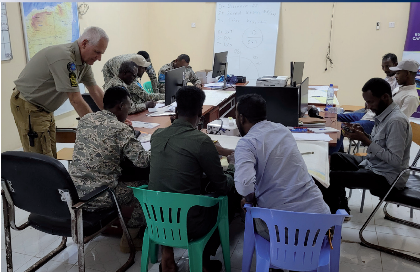
EUCAP Somalia hjælper det civile politi med at blive bedre til at varetage opgaver som command & control – der er aktiviteter, processer og teknologier, som bruges til at styre og koordinere operationer, krisehåndtering og nødsituationer.