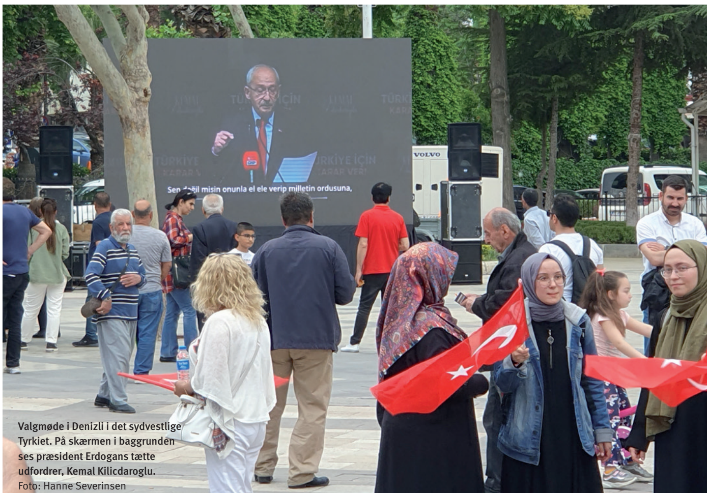
Valgmøde i Denizli i det sydvestlige Tyrkiet. På skærmen i baggrunden ses præsident Erdogans tætte udfordrer, Kemal Kilicdaroglu.

Også de tyrkiske valgmyndigheder skal anerkendes for deres tilrettelæggelse og gennemførelse af valghandlingerne og det efterfølgende optællingsarbejde. Samtidig skal det dog tilføjes, at der er udfordringer med regeringskoalitionens mediemonopol, misbrug af statsapparat og retsvæsen.