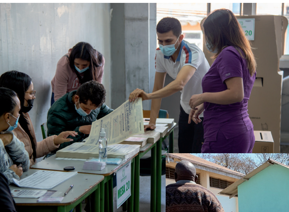
Landene i Latinamerika er generelt mere stabile og demokratiske end i Afrika, selvom der ofte er tale om dysfunktionelle demokratier. Billedet stammer fra præsidentvalget i Colombia i sommeren 2022. EU. Foto: EU EOM Colombia