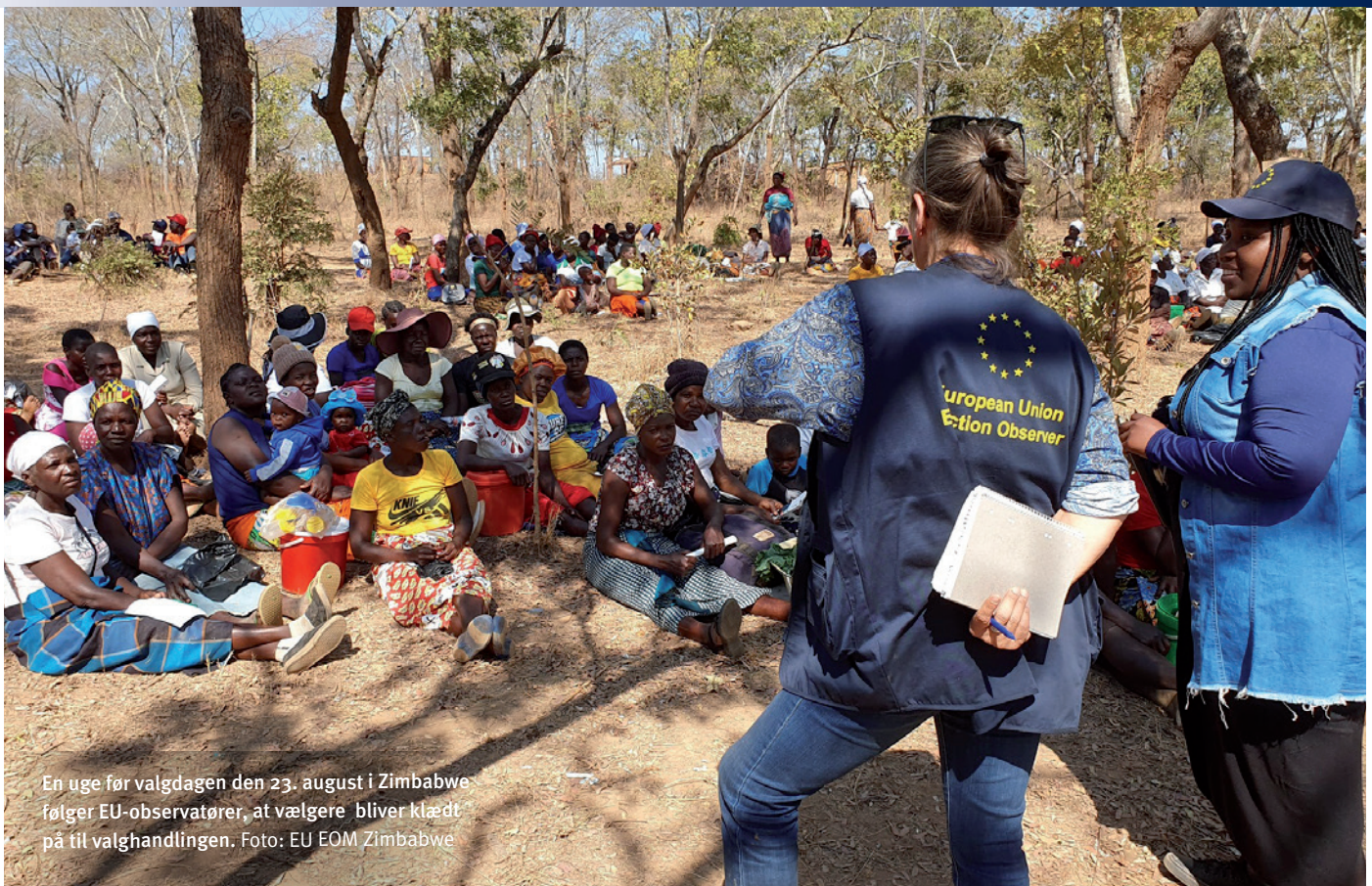
En uge før valgdagen den 23. august i Zimbabwe følger EU-observatører, at vælgere bliver klædt på til valghandlingen.

tilbagegang på tværs af landene, men er generelt mere stabilt og demokratisk, selvom der ofte er tale om dysfunktionelle demokratier.”