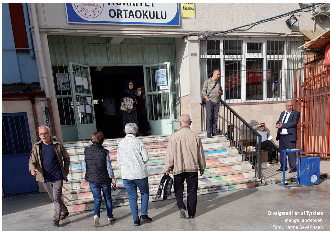
Et valgsted i en af Tyrkiets mange landsbyer.