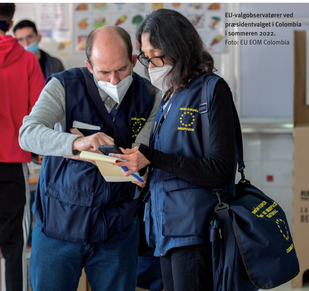
EU-valgobservatører ved præsidentvalget i Colombia i sommeren 2022.