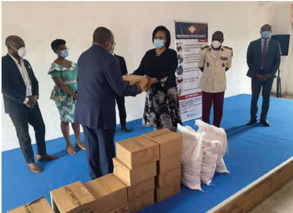
Billede 7: COVID-19 gjorde det i 2020 nødvendigt for UN PBF at udvise omfattende fleksibilitet i implementeringen af eksisterende og nye indsatser. Dette førte særligt i Vestafrika til et stigende fokus på beskyttelse og fremme af menneskerettigheder.

COVID-19 medførte også stigende fokus på menneskerettighedsovergreb ifm. erklæringen af undtagelsestilstand i en række lande med særligt fokus på Vestafrika. I Gambia støttede UN PBF etablering og kapacitetsopbygning af den nationale menneskerettighedskommission, der ifm. COVID-19 øgede sin træning af politiet i rettighedsbeskyttelse. I Guinea blev 35 repræsentanter for lokale menneskerettighedsgrupper trænet for at styrke kapaciteten til at monitorere sikkerhedsstyrkers adfærd og dokumentere eventuelle menneskerettighedsovergreb. I Togo støttede UN PBF ligeledes træning af 15 menneskerettighedsforkæmpere i at monitorere menneskerettighedsovergreb samt finansierede relevante teknologiske redskaber til indhentning og deling af information. Projektet viste hurtigt resultater og i sommeren 2020 var ca. 30 sager blevet rapporteret.