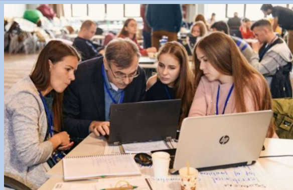
Billede 9: Hack For Locals 1.0 i byen Kharkiv. Her mødtes lokale borgere, NGO'er og virksomheder for at finde konkrete digitale løsninger på hverdagsproblemer i Østukraine.

COVID-19 har skærpet behovet for digitale løsninger. Men i Østukraine har nye e-løsninger også været med til at løse mere grundlæggende problemer med adgang til offentlige services og deltagelse i beslutningsprocesser.