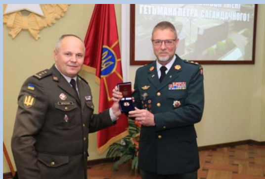
Billede 8: Rådgiveren tildeles ukrainsk æresmedalje (Badge of Honour).

Som en del af den danske støtte til Ukraine inden for rammerne af Fonden har det danske forsvar i 2020 haft en rådgiver udsendt ved skolen. Rådgiveren har været med til at udvikle en moderne videreuddannelse for officerer i tråd med NATO-standarder og har ydet en meget anerkendt støtte til sproguddannelsen. Den 9. december 2020 blev rådgiveren tildelt den ukrainske forsvarsministers æresmedalje Badge of Honour for sin indsats ved skolen.