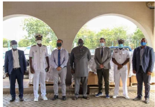
Billede 13: Overdragelse af videokonferencendstyr i Ghana.