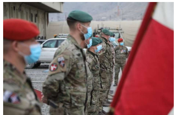
Billede 4: Afghanistan: Soldaterne fra det nationale støtteelement hold 13 står klar til medaljepræsentation.

Trods aftalen mellem USA og Taleban om tilbagetrækning af USA's militære styrker fortsatte konflikten i 2020 med kampe mellem afghanske sikkerhedsstyrker og Taleban og andre grupper, herunder ISIL, i tillæg til målrettede angreb på prominente personer som f.eks. journalister og dommere. Fredsforhandlingerne med Taleban påbegyndtes i september i Doha, og USA havde ved årets udgang omkring 2.500 soldater i Afghanistan.