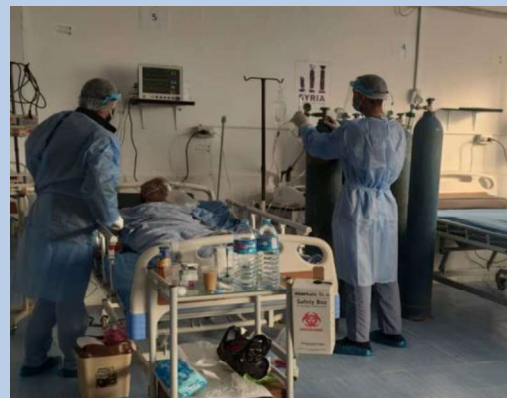
Billede 2: Udsnit af ny-oprettet behandlingscenter i Raqqa.

Også Rigspolitiet har måttet omstille deres indsatser, eksempelvis i Irak, hvor de sammen med FN gennemførte kurser virtuelt, så de danske instruktører i Danmark stod for undervisningen, og de irakiske kursister var samlet i Irak og modtog undervisningen via storskærm. Afviklingen af kurserne virtuelt gav positiv feedback fra de irakiske kursister, og i alt afviklede dansk politi syv kurser i henholdsvis efterforskning og analysebaseret politiarbejde med i alt 98 irakiske kursister og to danske politiinstruktører i løbet af 2020.