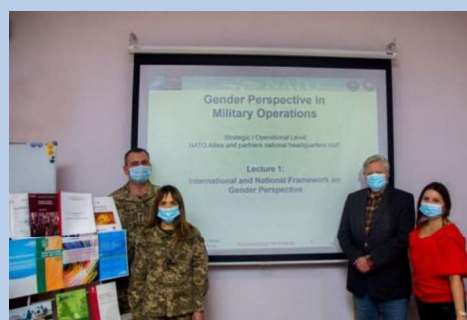
Billede 15: Undervisning i kønspektiver i den militære opgaveløsning ved NDU i Ukraine

Fremadrettet vil Fonden i højere grad tænke dagsordenen ind i tilrettelæggelsen af nye programmer og styrke engagementer, der flugter med prioriteterne for den nye danske handlingsplan.