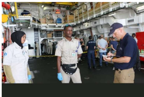
Billede 6: Den danske politirådgiver sekunderet til UNODC træner somalisk maritimt politi i, hvordan man undersøger gerningssteder.