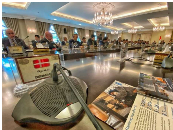
Billede 3: Møde i Bagdad med den irakiske regering om den internationale stabiliseringsindsats.

til at inkludere projekter med direkte relevans for respons på COVID-19.