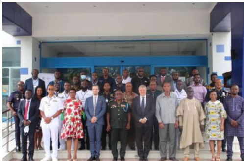
Billede 12: Kursister på maritimt sikkerhedskursus i Takoradi, Ghana, ved Kofi Annan International Peacekeeping Training Centre i august.