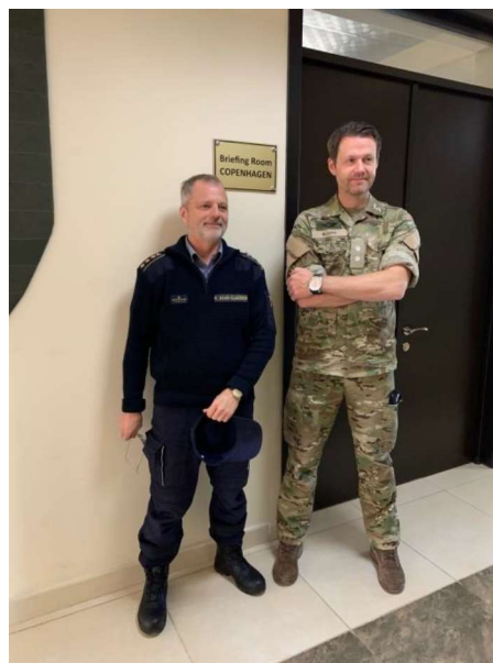
Billede 14: De to udsendte danske rådgivere i Georgien foran et dansk doneret mødelokale i JTEC.

supplering af det daglige beredskab under Emergency Management Services.