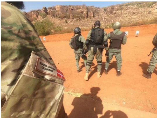
Billede 10: Fra Forsvarsakademiets konference på Kofi Annan International Peacekeeping Training Centre, Ghana.

samfundene i de berørte områder desuden fået indført varslingsmekanismer.