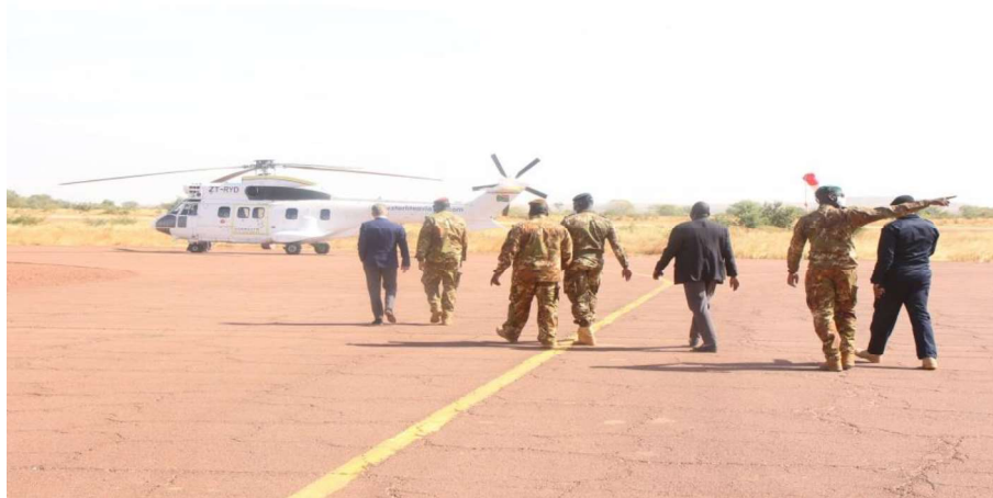
Billede 1: Danmark bidrager bl.a. gennem EUCAP Sabel Mali til at støtte de maliske sikkerhedsstyrkers genetablering af statsstrukturer og den civile administration i landområderne, særligt i det centrale Mali.

COVID-19 har illustreret, at der også i fremtiden vil være behov for, at Freds- og Stabiliseringsfonden kan imødekomme akutte behov for allokering af midler til fleksibel og hurtig støtte i skrøbelige kontekster og konfliktområder, der falder inden for regeringens prioriteter.