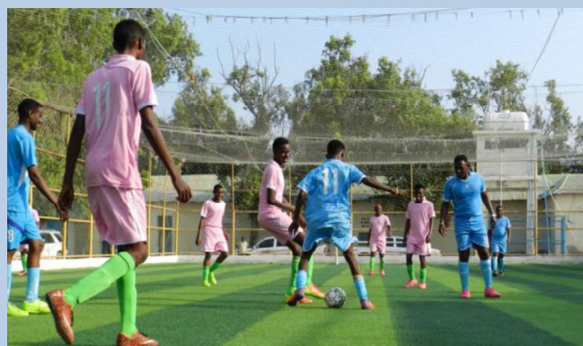
Billede 5: Fodboldturnering i Serendi centeret for al-Shabaab -afhoppere i Mogadishu, Somalia.

I Somalia fortsatte samarbejdet med regeringen om demobilisering og rehabilitering af al-Shabaab -afhoppere, herunder træning i screening og risikovurdering af personer, der har nedlagt våbnene og udtrykt ønske om at blive rehabiliteret og reintegreret i deres oprindelige lokalsamfund.