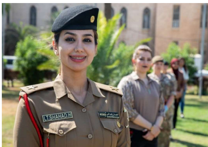
Billede 16: Også i Irak blev 20-året for FN's resolution 1325 om kvinder, fred og sikkerhed fejret. Danmark støtter gennem Freds- og Stabiliseringsfonden Iraks arbejde med fremme af dagsordenen.

I 2021 vil Freds- og Stabiliseringsfonden i alt have en ramme på 513,8 mio. kr., hvoraf 102,5 mio. kr. kommer fra Forsvarsministeriet, mens Udenrigsministeriet bidrager med 400 mio. kr. ODA samt 11,3 mio. kr. i non-ODA.