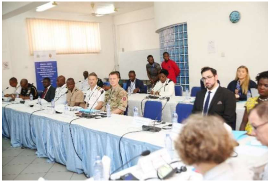
Billede 11: Fra Forsvarsakademiets konference på Kofi Annan International Peacekeeping Training Centre, Ghana.