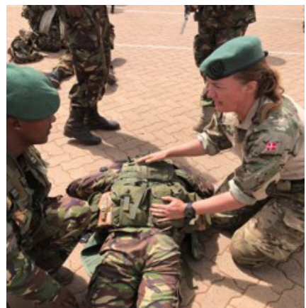
Instruktører fra Hjemmeværnet underviser kenyanske soldater i førstehjælp

Danmark vil arbejde for, at WPS-dagsordenen fremmes som en del af FN's reformarbejde, særligt gennem Generalsekretærens reformdagsordener på freds- og sikkerhedsområdet, Action for Peacekeeping (A4P) og sustaining peace-dagsordenerne. Det planlagte danske medlemskab af FN's Fredsopbygningskommission vil bl.a. muliggøre et substantielt dansk engagement og en styrket dansk stemme i FN's arbejde med kvinder, fred og sikkerhed. I mellemstatslige forhandlinger, hvor WPS-dagsordenen er under pres, vil Danmark ligeledes fremme en stærk og progressiv tilgang.