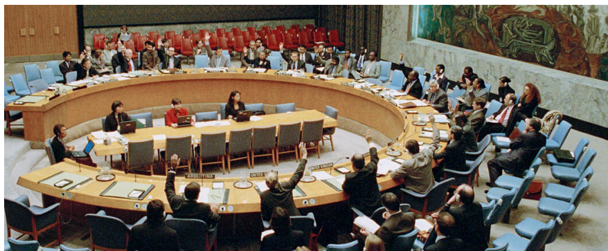
Resolution 1325 vedtages i FN's Sikkerhedsråd d. 31. oktober 2000

beskytte civilbefolkningen - særligt kvinder og piger. Fordi vi ofte arbejder og opererer i lande og samfund, hvor lokale kvinder netop har begrænset adgang til at deltage i politiske processer, er tilstedeværelsen af kvinder med til at øge adgangen og styrke dialogen. Det handler også om, at en mere repræsentativ sammensætning skaber bedre opgaveløsning og resultater. Danmark vil derfor øge fokus på rekruttering, fastholdelse og karrierefremme af kvinder, ikke mindst i ledelsespositioner, både inden for Forsvaret – herunder Hjemmeværnet og Beredskabet – inden for Rigspolitiet og i Udenrigsministeriet. Flere kvinder end tidligere ser i dag Forsvaret som en karrieremulighed, hvilket bl.a. har betydet en stigning i tilstrømningen af kvinder til både værnepligtsuddannelsen og Forsvarets øvrige uddannelser de seneste 12-15 år. Den gode udvikling skal vi fortsætte og forstærke, herunder gennem øget rekruttering,