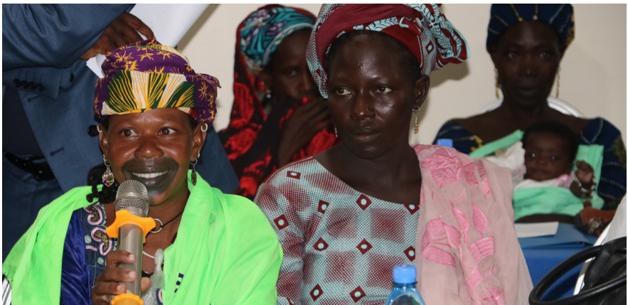
Kvinder i Mali deltager i en workshop om den regionale sikkerhedsstyrke, G5 Sahel fællesstyrken