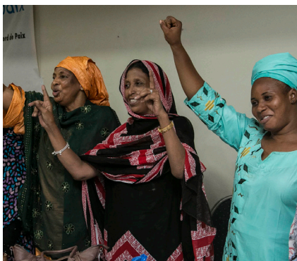
Kvinder i Mali deltager i et møde om at øge kvinders deltagelse i fredsprocessen

verdens brændpunkter, der har fokus på konfliktforebyggelse, konfliktløsning og fredsopbygning. Danmarks fredsopbygnings- og stabiliseringsindsatser finansieres primært gennem Freds- og Stabiliseringsfonden, som i højere grad skal målrettes til at styrke dagsordenen for kvinder, fred og sikkerhed. Kommende evalueringer og programmer vil derfor indeholde en vurdering af, hvordan nuværende og fremtidige aktiviteter i endnu højere grad kan indarbejde kønsperspektiver og skabe resultater for de kvinder og piger, der lever i indsatsområderne. Desuden vil såvel internationale som lokale implementerende samarbejdspartnere, hvor relevant, blive bedt om at forholde sig konkret til, hvordan WPS-dagsordenen kan styrkes gennem fremtidige aktiviteter. Det er Freds- og Stabiliseringsfondens mål at gøre en endnu større forskel også for kvinder og piger.