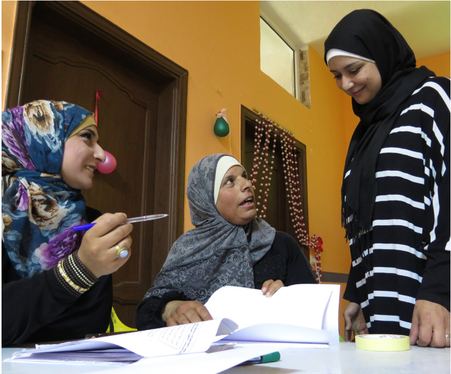
I mange lande er kvinder udelukket fra formelle såvel som uformelle beslutningsprocesser

Handlingsplanen bliver yderligere konkretiseret i de tilhørende implementeringsplaner for hver af de involverede instanser: Udenrigsministeriet, Forsvarsministeriet og Justitsministeriet (Rigspolitiet). Arbejdsgruppen koordinerer indsatsen med at følge op på implementeringsplanerne og civilsamfundets inddragelse. Det sker dels i et årligt kontaktforum, hvor planens strategiske og overordnede målsætninger drøftes, samt i mere specialiserede undersøgelser i form af