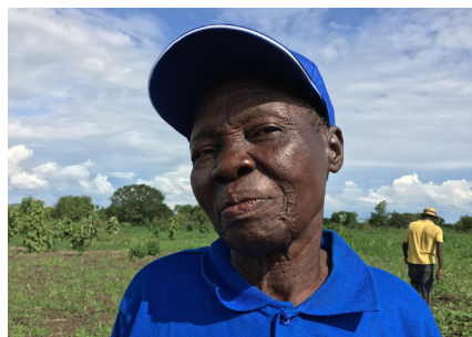
Danmark har i mange år kæmpet for kvinders rettigheder og ligestilling

Danmark spillede en aktiv rolle i det forberedende arbejde med at få vedtaget sikkerhedsrådsresolution 1325 og var i 2005 det første land i verden til at udarbejde en national handlingsplan for implementering af resolutionen. Handlingsplanen blev opdateret i hhv. 2008 og 2014. I 2005/06 havde Danmark desuden en plads i Sikkerhedsrådet og nød derfor