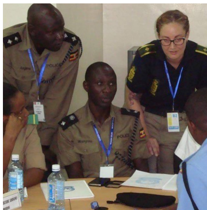
Danske politikvinder og -mænd bidrager med træning bl.a. i Afrika og Mellemøsten

I denne handlingsplan opererer vi med et binært kønsbegreb (kvinde/mand). Valget er truffet af praktiske hensyn, fordi det afspejler den differentiering, der rapporteres ud fra i vores aktiviteter. Kønsidentitet og kønsroller påvirkes ofte af et samfunds normer, kultur og forventninger. Dette tager vi hensyn til i de områder vi engagerer os i såvel som i den nationale indsats. Selvom anvendelsen af de binære kønsbetegnelser således er et praktisk valg, er det samtidig baseret på en bevidsthed om og anerkendelse af eksistensen af mere flydende kønsidentiteter end de binære kvinde/mand og pige/dreng.