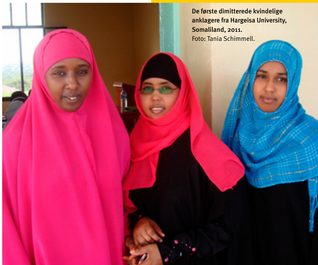
De første dimitterede kvindelige anklagere fra Hargeisa University, Somaliland, 2011. Foto: Tania Schimmell.

Kilde: 'Danmarks samtænkte stabiliseringsindsatser i verdens brændpunkter', september 2013