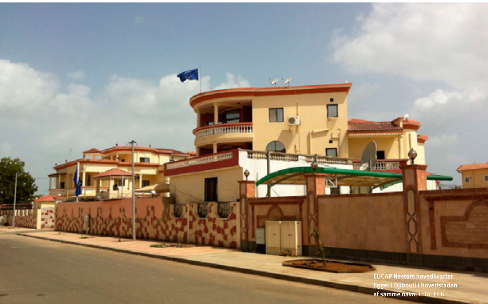
EUCAP Nestors hovedkvarter ligger i Djibouti i hovedstaden af samme navn.

EU NAVFOR og EUTM Somalia (EU Military Training Mission). EU NAVFOR patruljerer mod pirateri i regionen, mens EUTM bidrager til uddannelsen af somaliske sikkerhedsstyrker.