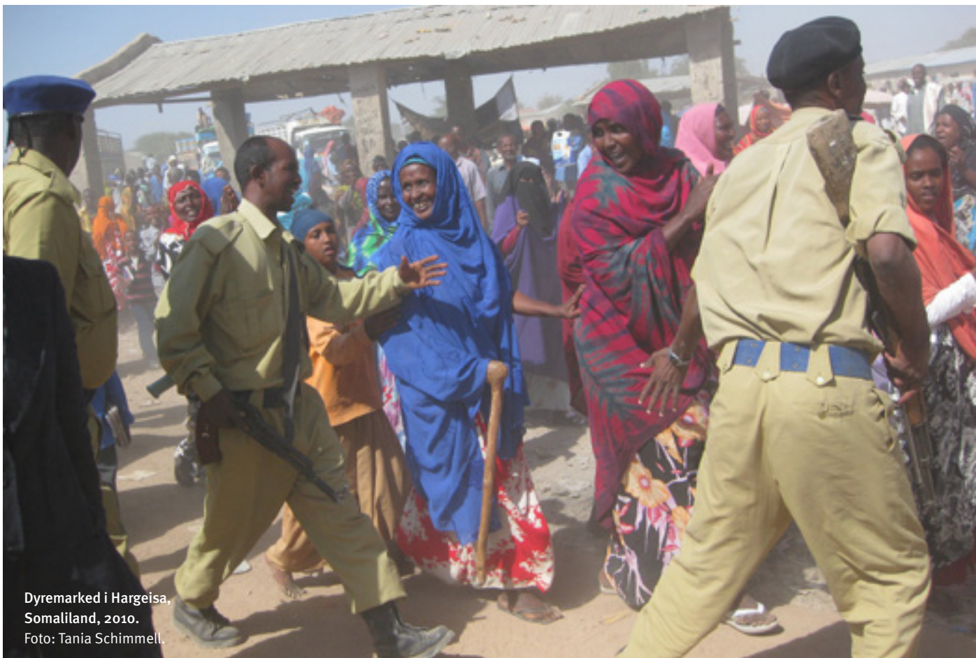
Dyremerked i Hargeisa, Somaliland, 2010.