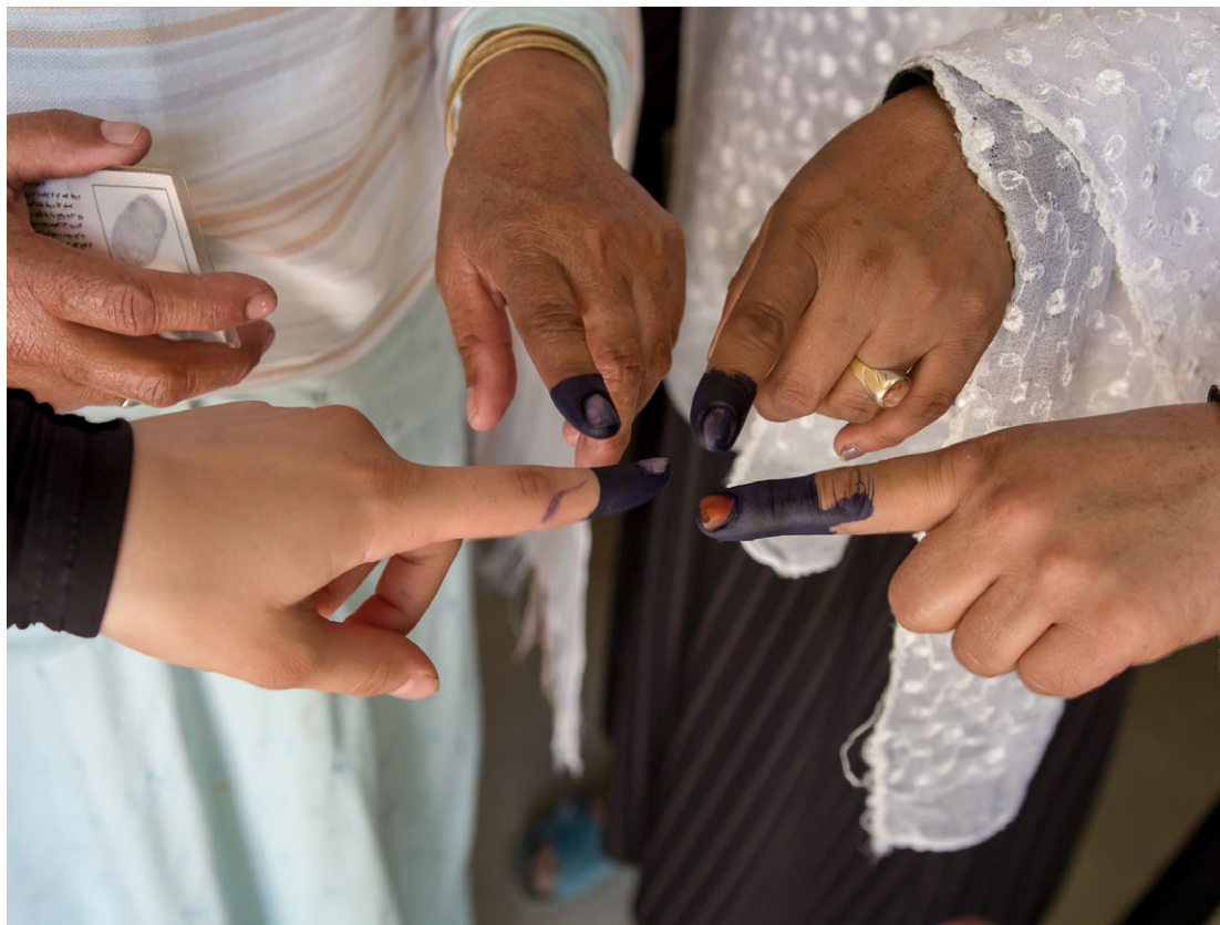
Afghanske kvinder, der har stemt til anden runde af præsidentvalget i Afghanistan i 2014.

Danmark vil være en markant global forsvarer for menneskerettigheder, demokrati og ligestilling. Vi vil fremme disse værdier i en lang række sammenhænge lige fra vores kontakt med private virksomheder til en aktiv deltagelse i FN-forhandlinger herom. Menneskerettigheder, demokrati, god regeringsførelse, retsstatsprincipper og ligestilling er et selvstændigt prioriteret område i det danske udviklingsamarbejde. Det er forudsætningen for at opnå verdensmålene og en integreret del af dem, særligt mål 5 (ligestilling) og mål 16 (fred, retfærdighed og institutioner), men også mål 1 (fattigdom), hvor jord- og ejendomsret fremgår. Danmark vil støtte demokratiers rettighed til at være demokratier, herunder som ligeværdige partnere i multilaterale organisationer – et vigtigt initiativ her er Naboskabsprogrammet, der er fokuseret på de skrøbelige demokratier i Ukraine og Georgien.