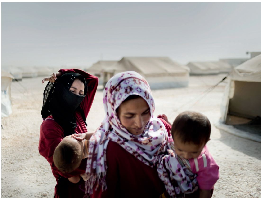
Familie netop ankommet i Zaatari flygtningelejr i Jordan, hvor omkring 80.000 syrere lever.

Fred og sikkerhed samt udfordringerne for lande ramt af konflikt og skrøbelighed står centralt i verdensmålene. Det gælder først og fremmest verdensmål 16 (fred, retfærdighed og institutioner), som vil stå centralt i det danske engagement. Derudover prioriterer vi i og omkring skrøbelige lande og situationer mål 1 (fattigdom), mål 2 (sult) og mål 8 (vækst og beskæftigelse). Vi fremmer også andre mål, bl.a. på det sociale område mål 4 (uddannelse) og mål 5 (ligestilling) gennem vores multilaterale indsatser og civilsamfundssamarbejdet.