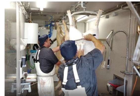
Скотобійня в роботі