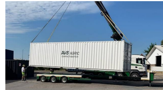
Скотобійня готова до відправки

AVS Agric Sysselbjergvej 27, DK - 6051 Almind +45 2946 2442 www.avsagric.com mw@avsagric.com